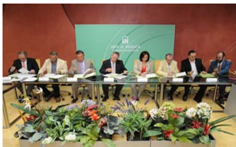
Los firmantes del acuerdo

Es motivo de alegría que la Consejería demuestre el talante y la sensibilidad necesaria para asegurar la estabilidad de