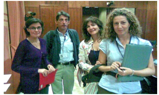
Nuestros compañeros momentos antes de la intervención en el Parlamento

“Si algo ha caracterizado a este colectivo (interinos) desde sus comienzos es la precariedad laboral que ha venido sufriendo.