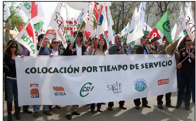
Momento de una de las movilizaciones convocadas

Pero se da la circunstancia de que el Tribunal Superior de Justicia de Andalucía, en sentencia del año 2006, dictaminó que este sistema de doble ordenación es ilegal. Los interinos/as no podemos acceder a un mismo puesto público mediante criterios diferentes. No hace falta estudiar leyes para darse cuenta de que este sistema vulnera el principio constitucional de igualdad. Entonces, ¿por